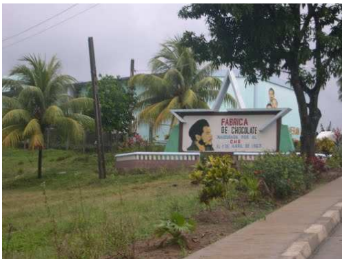
Fábrica de Chocolate

Actualmente existe una docena de instituciones en el territorio, entre ellas museos, casas de cultura, biblioteca, Cine La Casa del Chocolate en Baracoa, galería de arte, entre otras, las cuales trabajan de conjunto en la promoción de los valores culturales locales y nacionales; continuamente organizan varios eventos que convocan a escritores, artistas, investigadores e intelectuales locales y foráneos