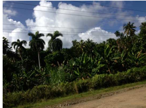
Finca de cultivo de coco

Existen plantadas 9 455 hectáreas de cocoteros, lo que representa el 32,2% de la tierra agrícola. Seis mil 216 hectáreas de tierra están sembradas de cacao, para un volumen del 21,2% de la superficie agrícola total. El 10,4 % de las tierras agrícolas del municipio, 3 mil 49 hectáreas, lo ocupa el cultivo del café.