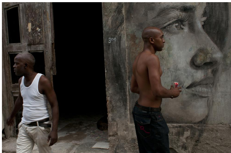
Habana Vieja

Durante la mañana, iniciaremos el taller con la revisión del portfolio de los participantes, charla teórica y visionado de imágenes impartida por Marcelo Caballero .