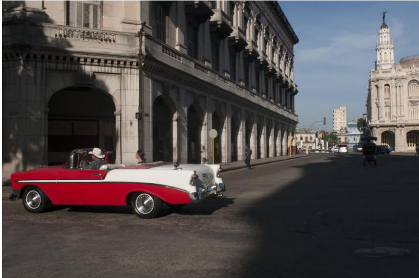
Habana Vieja, La Habana