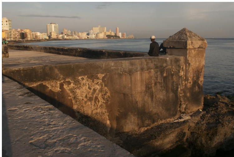
El Malecón

Amanecer en el Malecón. Centro Habana y Habana Vieja