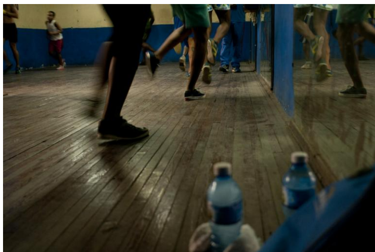
Gimnasio donde se preparan a futuros boxeadores. Habana vieja