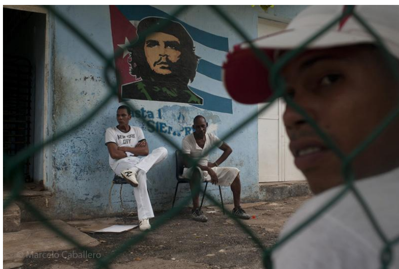
El Vedado, La Habana

“A medida que avancemos hacia los últimos días del taller – señala Marcelo - lógicamente los alumnos estarán mucho más naturalizados y tendrán “su propio universo visual de La Habana”. Por eso cada uno podrá ir proponiendo itinerarios urbanos alternativos y de eso tratará este último tramo en la ciudad. Ello hará útil el desenvolvimiento natural del workshop”