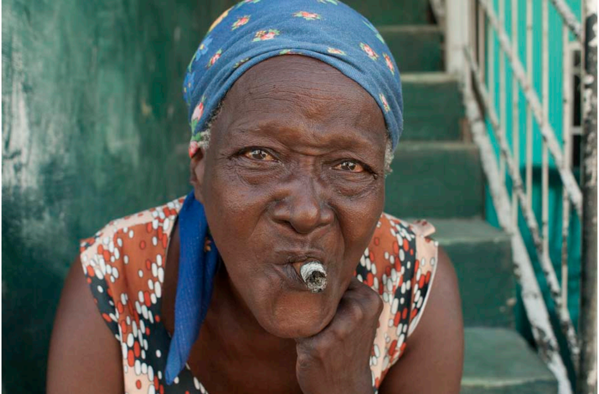
Cerro, La Habana

Por la tarde, entraremos de lleno en el mundo de la santería. El misterio de las religiones africanas, la música de los tambores. Visita a los representantes de las diferentes religiones cubanas en el barrio Centro Habana.