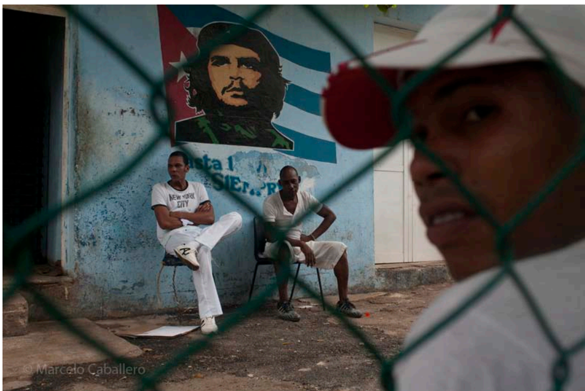
El Vedado, La Habana

“A medida que avancemos hacia los últimos días del taller – señala Marcelo - lógicamente los alumnos estarán mucho más naturalizados y tendrán “su propio universo visual de La Habana”. Por eso cada uno podrá ir proponiendo itinerarios urbanos alternativos y de eso tratará este último tramo en la ciudad. Ello hará útil el desenvolvimiento natural del workshop”