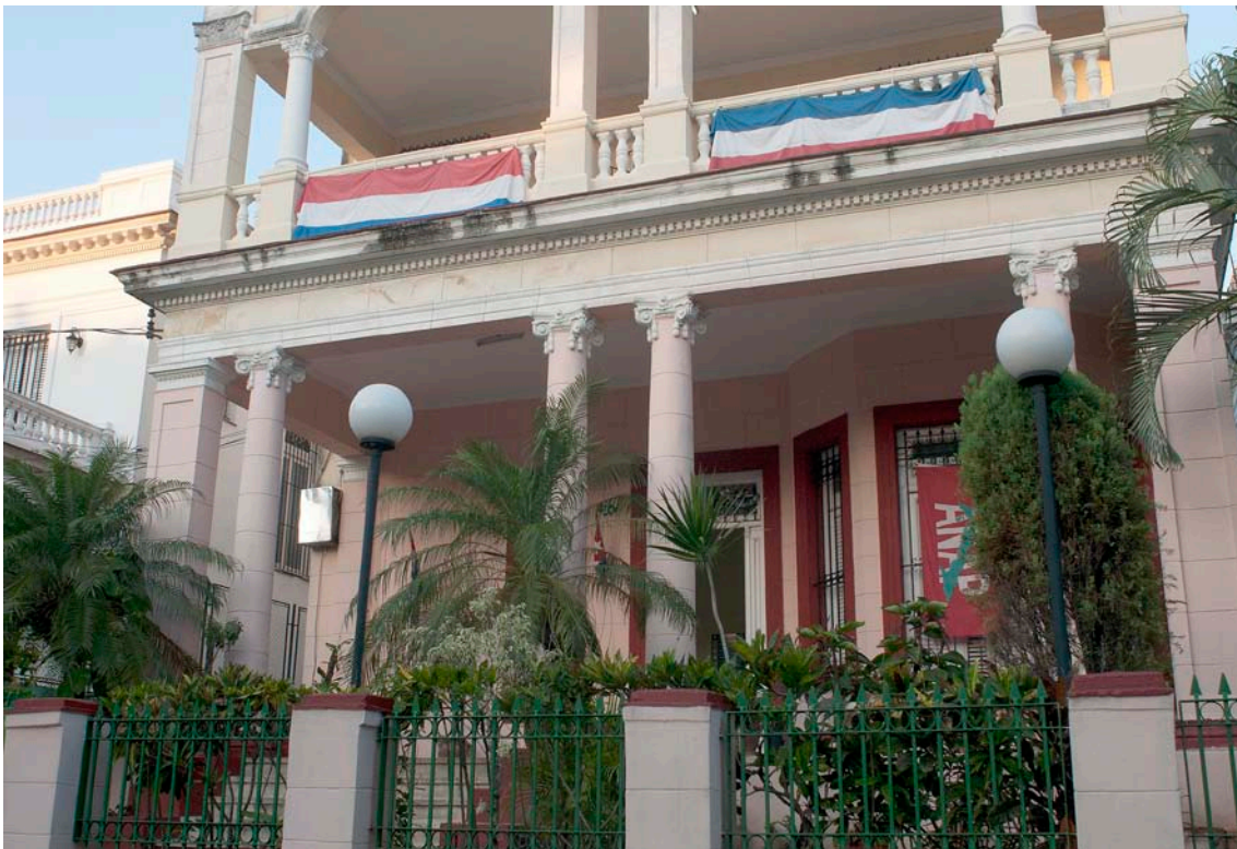
Casa de visitas. El Vedado

Los participantes se alojarán en una casa de visitas de la Asociación Nacional de Agricultores Pequeños (ANAP) , Casa colonial donde se hospedan los miembros de esta importante organización agrícola.