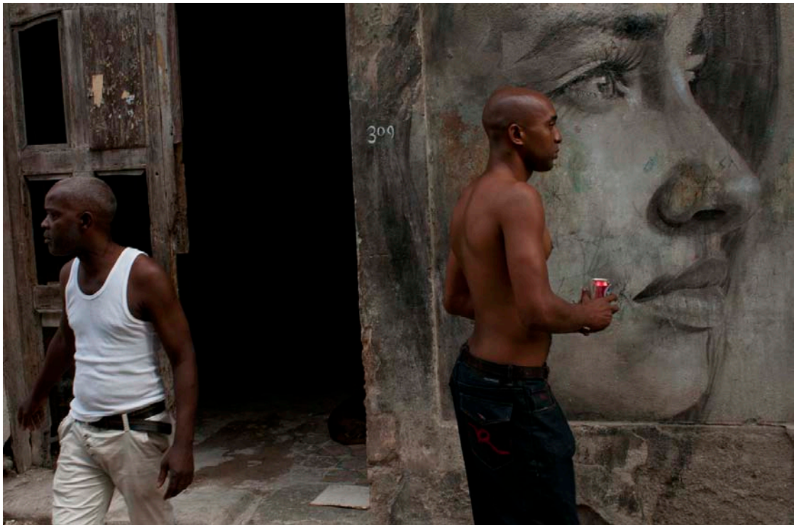
Habana Vieja

Durante la mañana, iniciaremos el taller con una charla teórica y visionado de imágenes impartida por Marcelo Caballero en la Escuela de Fotografía Creativa de La Habana (EFCH)